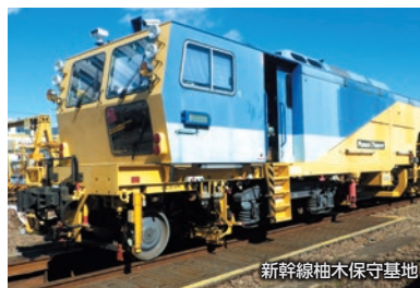
新幹線袖木保守基地

■「グランシップトレインフェスタ2023」開催に合わせて、さわやかウォーキング初登場の新幹線袖木保守基地や在来線静岡車両区、JR貨物 静岡貨物駅、静岡鉄道長沼車庫をご覧ください。