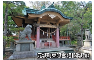
元城町東照宮(引間城跡)