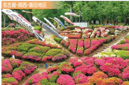
5/3 飯田線 伊那大島駅スタート・台城公園のつつじ