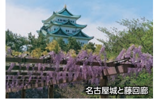
名古屋城と藤回廊

「名古屋城」や徳川義直が父家康公を祀るために創建した「名古屋東照宮」を巡ります。