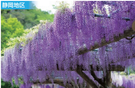
4/22 東海道線 藤枝駅スタート・蓮華寺池公園の藤