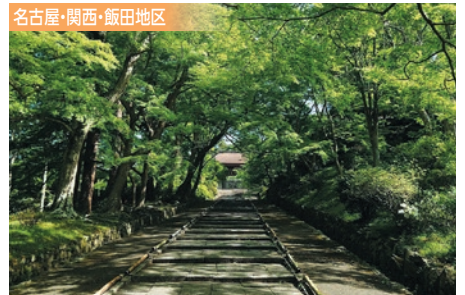
5/27 東海道新幹線 京都駅スタート・毘沙門堂門跡