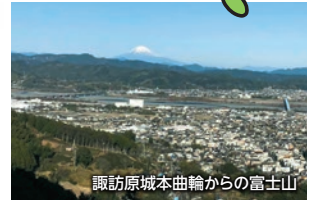
諏訪原城本曲輪からの富士山