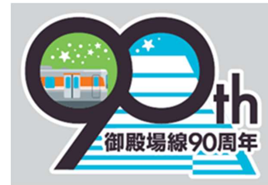
御殿場線90周年記念ロゴマーク