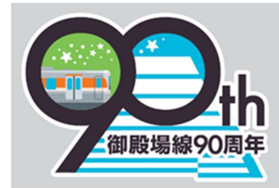
御殿場線90周年記念ロゴマーク