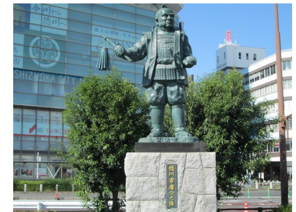
徳川家康公像(静岡駅北口)